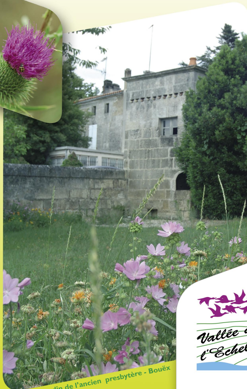
Jardin de l'ancien presbytère - Bouëx